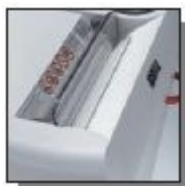
Volet de sécurité électronique