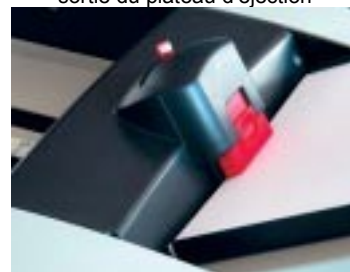
Pas besoin d'étaler le papier