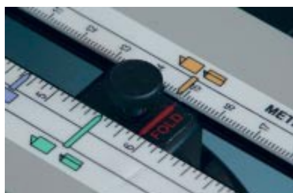
Positionnement facile et rapide du curseur